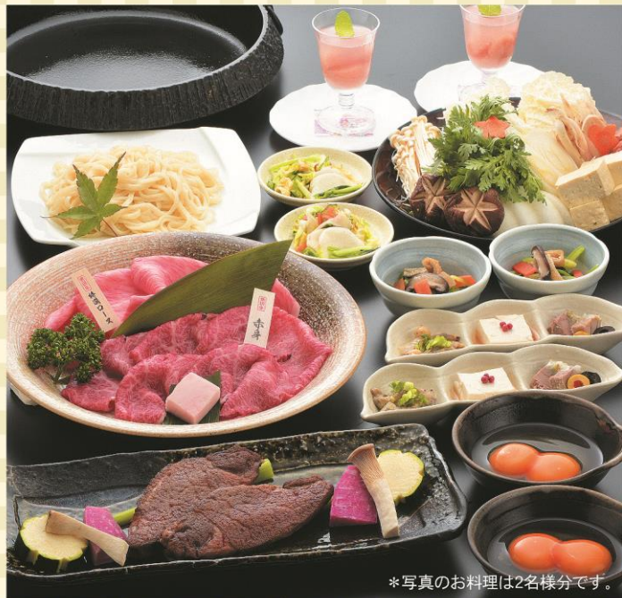
*写真のお料理は2名様分です。