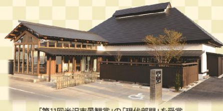
「第11回米沢市景観賞」の「現代部門」を受賞。