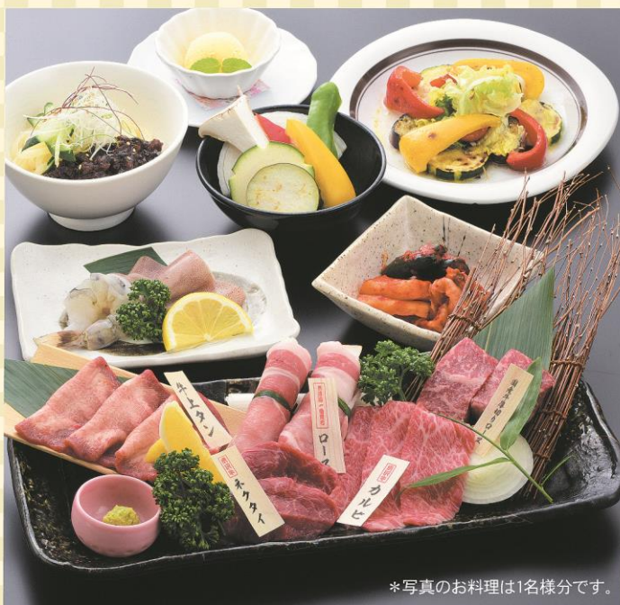
*写真のお料理は1名様分です。